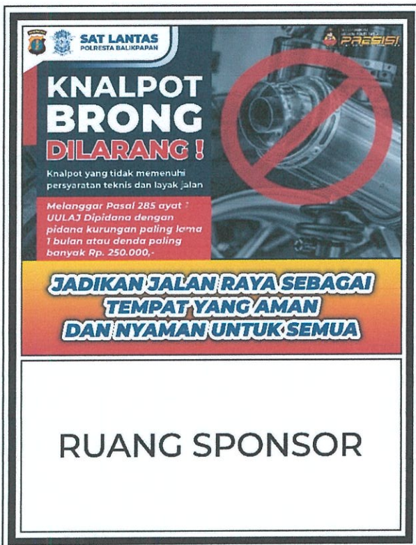
Gambar No. 11