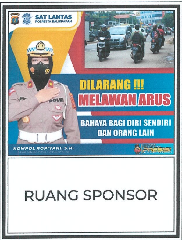
Gambar No. 7