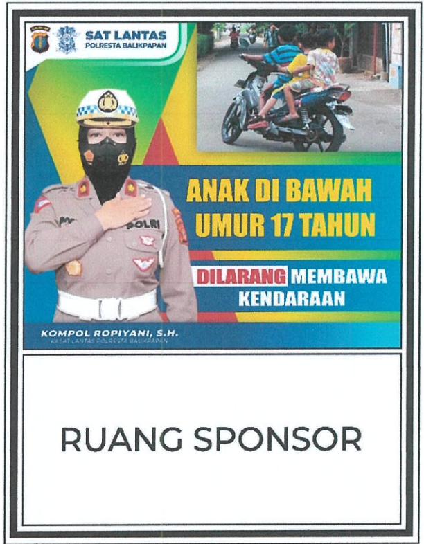
Gambar No. 6