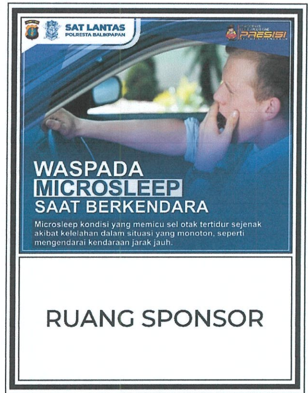
Gambar No. 10