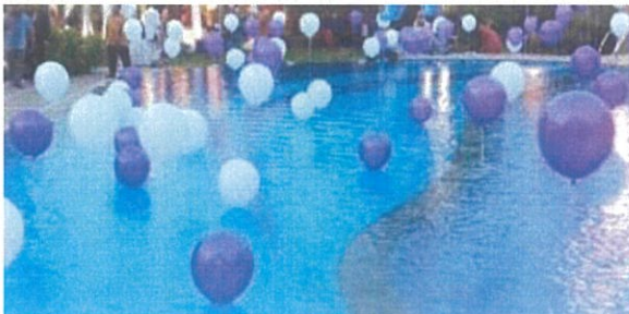
Dekorasi Diatas Kolam Renang