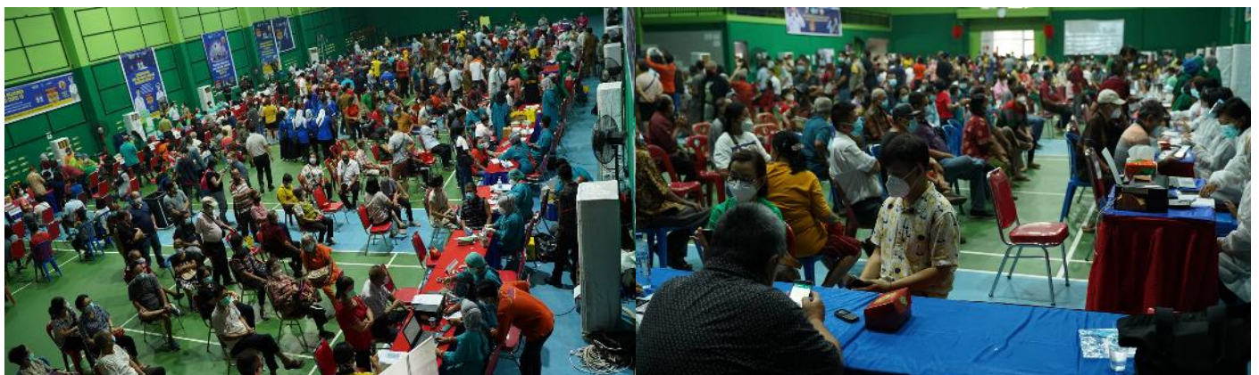
Iklan Banner 5m x 2m di GOR yang senantiasa ramai oleh kegiatan - ( turnamen Badminton IKPTB Cup)