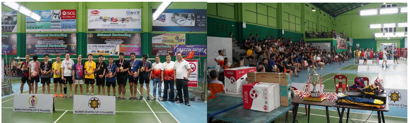
Iklan Banner 5m x 2m di GOR yang senantiasa ramai oleh kegiatan - ( turnamen Badminton IKPTB Cup)