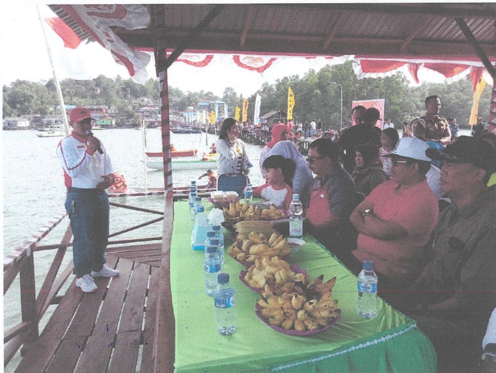
Sambutan Ketua Panitia di hadapan Walikota Balikpapan pada lomba Ketinting