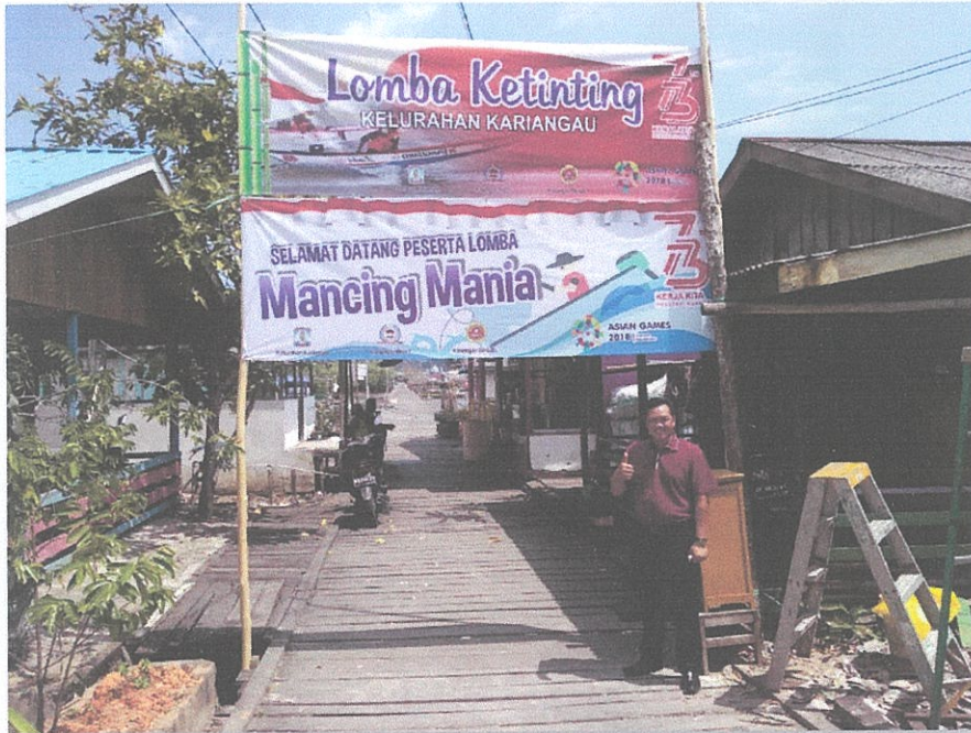
Spanduk Lomba Ketinting dan Mancing di RT 1 dan 2 Kel Kariangau