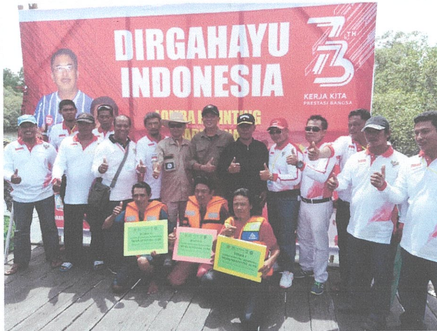
Penyerahan Hadiah Lomba Ketinting oleh Camat Balikpapan Barat