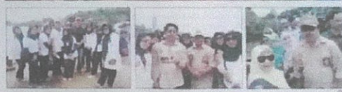
MERIAH Kegiatan pengukuhan pengurus Karang Taruna se Balikpapan dan lomba balap ketinting tradisional yang berlangsung di Jembatan Ulin, Karangasem, Balikpapan Barat, Minggu (17/3) kemarin berlangsung meriah.

Kliping Koran menyampaikan pelantikan pemgurus Karang Taruna Kelurahan se Kota Balikpapan dan Lomba Ketinting, 18 Maret 2019